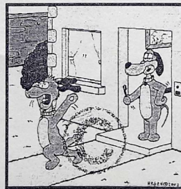
Come on I'm not rabies! I was just cleaning my teeth when you rang...